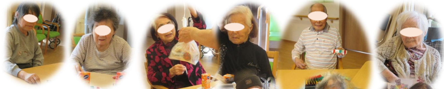
5月14日 輪投げとお菓子釣り大会開催 おやつゲットで童心にかえり楽しみました。