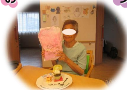
♡5月5日 お誕生日でした♡